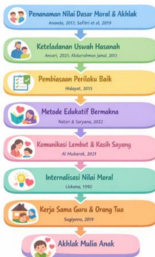
Gambar 2. Langkah-Langkah Pembelajaran Untuk Anak Usia Dini

Selain itu, hasil penelitian terdahulu menunjukkan bahwa strategi pendidikan moral dan akhlak yang efektif pada anak usia dini meliputi metode pembiasaan, bercerita, bermain peran, pemberian contoh nyata, serta kolaborasi antara guru dan orang tua (Natari & Suryana, 2022; Pitaloka et al., 2021). Strategi-strategi tersebut memiliki kesesuaian dengan metode pendidikan yang dicontohkan oleh Rasulullah SAW dalam mendidik anak-anak dan umatnya.