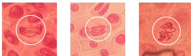
Gambar 3. 3 Aberasi di konsentrasi 10% (A) - bridge in anaphase , (B) multi bridge in anaphase , dan (C) - bridge in telophase

Pada perlakuan ekstrak daun salam konsentrasi 15%, ditemukan empat bentuk aberasi kromosom, yaitu prophase with chromosome break , c-mitosis , sticky metaphase , dan not identified . Hasil pengamatan aberasi kromosom pada konsentrasi 15% ditunjukkan pada Gambar 3.4.