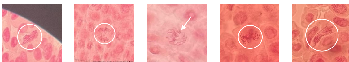
Gambar 3. 2 Aberasi di konsentrasi 5% - sticky metaphase (A), - anaphase with chromosome break (B), - ring (C), - not identified (D), dan - bridge anaphase (E)

Hasil pengamatan mikroskopis menunjukkan adanya beberapa bentuk aberasi kromosom pada sel akar bawang bombay yang diberi perlakuan ekstrak daun salam. Aberasi kromosom ditemukan pada perlakuan ekstrak daun salam konsentrasi 5%, 10%, dan 15%. Pada perlakuan ekstrak daun salam konsentrasi 5%, ditemukan lima bentuk aberasi kromosom, yaitu sticky metaphase , anaphase with chromosome break , ring , not identified , dan bridge anaphase . Hasil pengamatan aberasi kromosom pada konsentrasi 5% ditunjukkan pada Gambar 3.2.